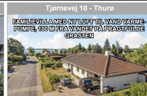
Tjørnevej 10 - Thurø

FAMILIEVILLA MED NY LUFT TIL VAND VARMEPUMPE, 100 M FRA VANDET PÅ PRAGTFULDE GRÅSTEN