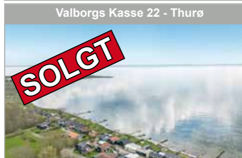
Valborgs Kasse 22 - Thurø