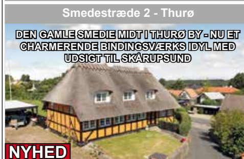
Smedestræde 2 - Thurø

DEN GAMLE SMEDIE MIDT I THURØ BY - NU ET CHARMERENDE BINDINGSVÆRKS IDYL MED UDSIGT TIL SKÅRUPSUND