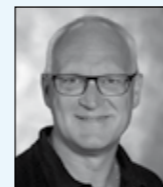
Preben Coach & Massør

Blåbærvænget 10, Thurø · tlf. 2484 3042 eller fysio@balladen.dk · www.balladen.dk