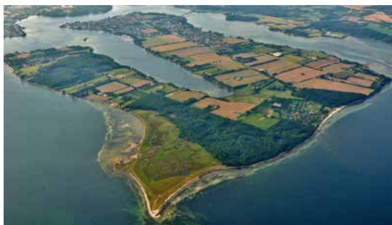
MVH Thurø Lokalråd Thurø udvikling - fælles indsats