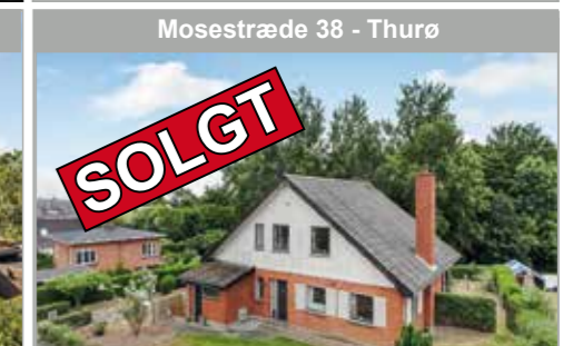
Mosestræde 38 - Thurø