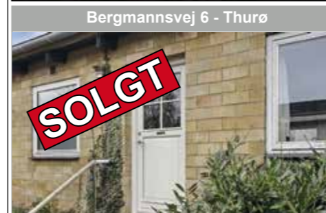
Bergmannsvej 6 - Thurø