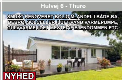
Hulvej 6 - Thurø

SMUKT RENOVERET BOLIG M. ANDEL I BADE-BADEBRØ, SOLCELLER, LUFT/VAND VARMEPUMPE, GULVVARME I DET MESTE AF EJENDOMMEN ETC.