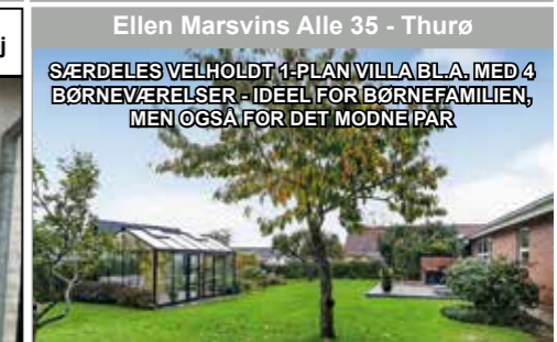
Ellen Marsvins Alle 35 - Thurø

SÆRDELES VELHOLDT 1-PLAN VILLA BLA. MED 4 BØRNEVÆRELSE - IDEEL FOR BØRNEFAMILIEN, MEN OGSÅ FOR DET MODNE PAR