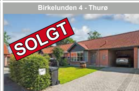
Birkelunden 4 - Thurø