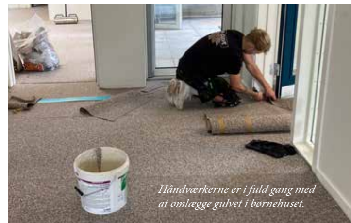
Håndværkerne er i fuld gang med at omlægge gulvet i børnehuset.