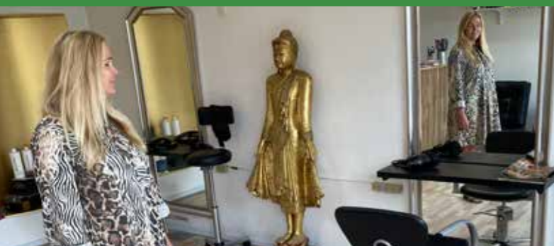
Leone spejler sig i Yin-yoga Side 50