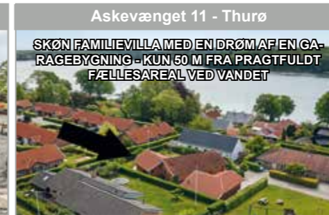
Askevænget 11 - Thurø

SKØN FAMILIEVILLA MED EN DRØM AF EN GARAGEBYGNING - KUN 50 M FRA PRAGTFULDT FÆLLESAREAL VED VANDET