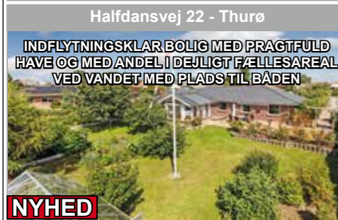
Halfdansvej 22 - Thurø

INDFLYTNINGSKLAR BOLIG MED PRAGTFULD HAVE OG MED ANDEL I DEJLIGT FÆLLESAREAL VED VANDET MED PLADS TIL BÅDEN