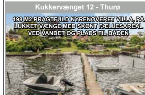
Kukkervænget 12 - Thurø

198 M2 PRAGTFULD NYRENOVERET VILLA, PÅ LUKKET VÆNGE MED SKØNT FÆLLESAREAL VED VANDET OG PLADS TIL BÅDEN