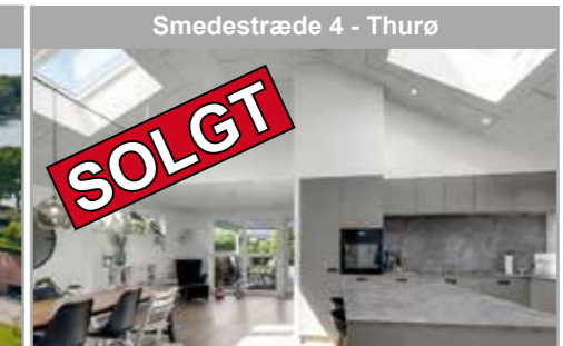
Smedestræde 4 - Thurø