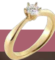
Dream ring fra eget design Collection Pind J

Ægte guldsmedekunst på vores eget værksted