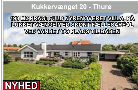
Kukkervænget 20 - Thurø

198 M2 PRAGTFULD NYRENOVERET VILLA, PÅ LUKKET VÆNGE MED SKØNT FÆLLESAREAL VED VANDET OG PLADS TIL BÅDEN