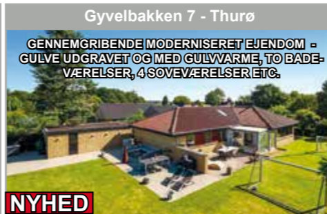
Gyvelbakken 7 - Thurø

GENNEMGRIBENDE MODERNISERET EJENDOM - GULVE UDGRAVET OG MED GULVVARME, TO BADEVÆRELSE, 4 SOVEVÆRELSE ETC.