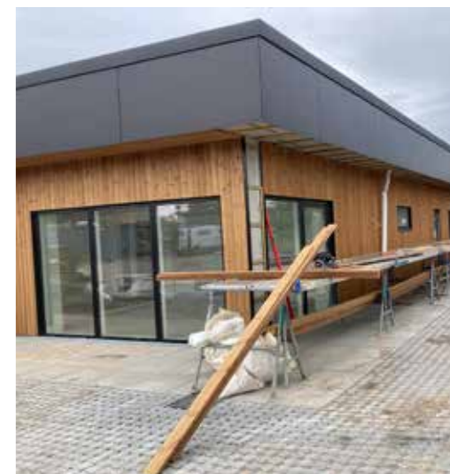
Legeplads og træbeklædning