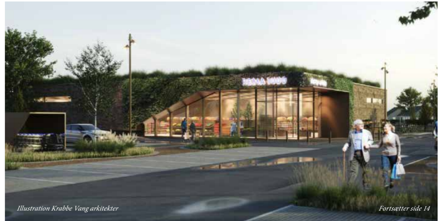
Illustration Krabbe Vang arkitekter

Hvordan ser I jeres muligheder for i fremtiden