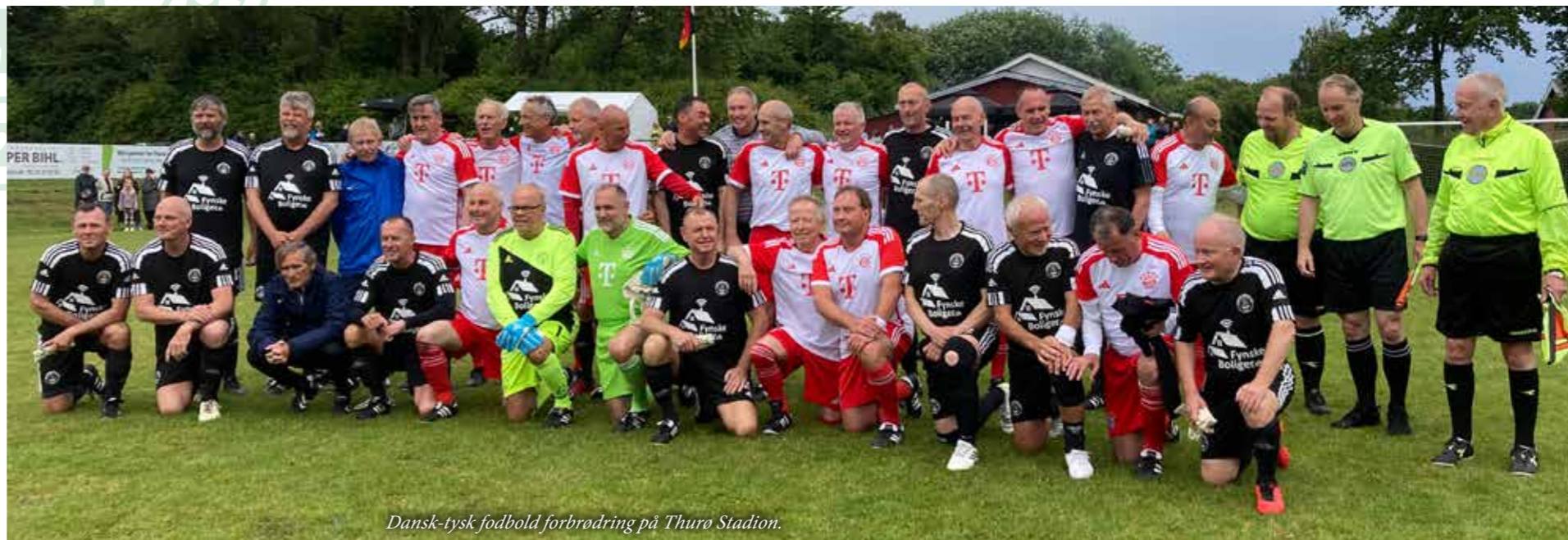
Dansk-tysk fodbold forbrødring på Thuro Stadion.